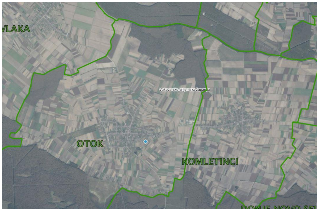
Slika 1: Katastarske općine Grada Otoka, Izvor: Državna geodetska uprava – obrada autora